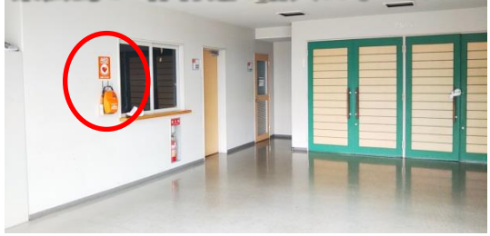
東広島C 体育館1階入口ホール