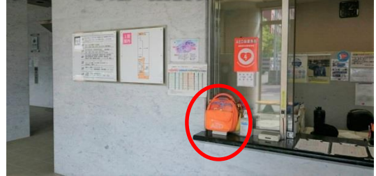
呉C 1号館1階防災センター