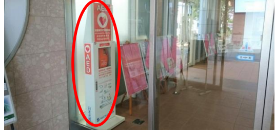
呉C 6号館1階入口(学部事務室前)