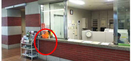
東広島C 体育館1階入口ホール