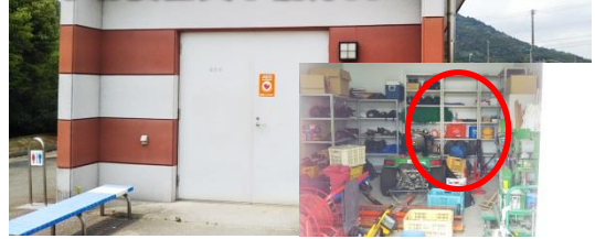
東広島C 屋外トイレ 野球場横器具子倉庫内