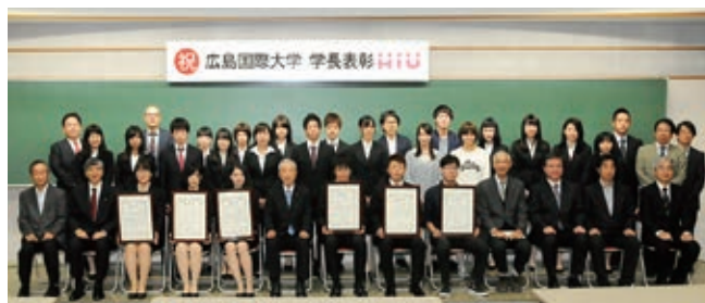
◀Step1コンテスト表彰式▶

Step 1の授業目的に基づき、「各専門職についての理解」「専門職連携」をテーマに学修成果をまとめたパネルを展示し、全学的なコンテストを実施しました。そして、このコンテスト結果に基づく、IPE Step 1 コンテスト表彰式を、10月21日(水)に開催しました。