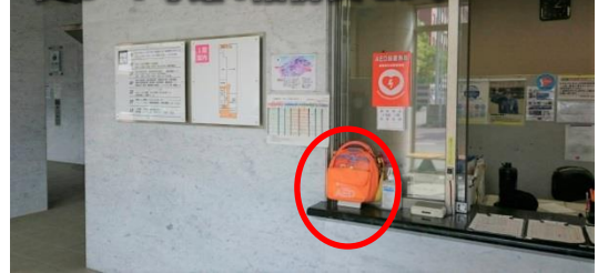
呉C 1号館1階防災センター