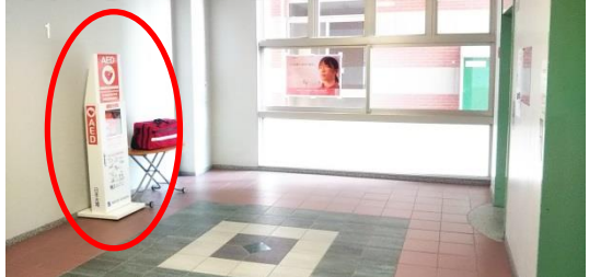
東広島C 学生研修棟A等棟 1階管理人室内