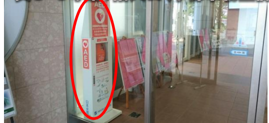
呉C 6号館1階入口(学部事務室前)