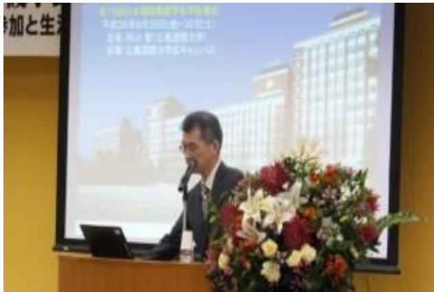
会長講演「難病患者の社会参加と生活設計」

さらに 2014 年の第 19 回学術集会でも学会長を務めました。専門は、難病看護／慢性疾患看護です。