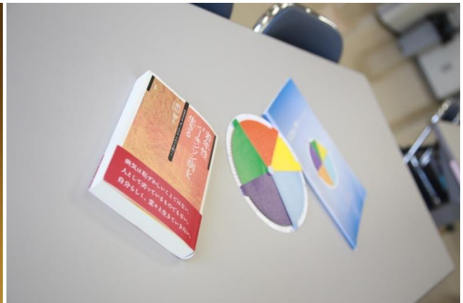
自分の研究は「SEIQoL-DW」を使用