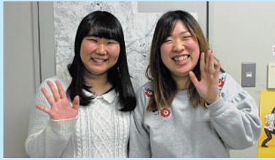
左から麗さん、林さん

最高の仲間に出会えた4年間でした!これからはお世話になった方々に恩返しして行けるように頑張ります!