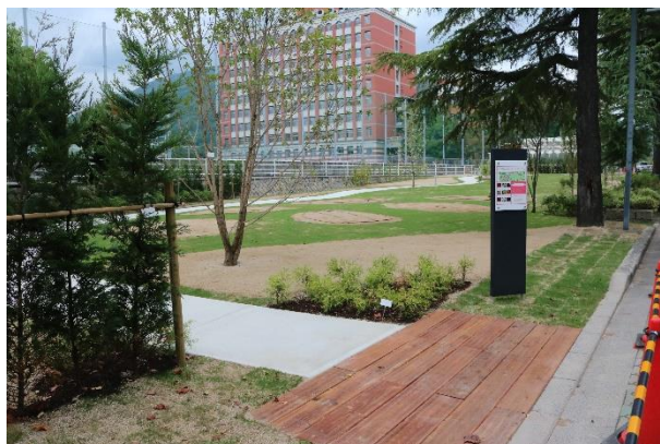
植栽前の「呉ローズガーデン」

つきましては、概要をお知らせしますので、取材で取り上げていただきたくよろしくお祈りいたします。