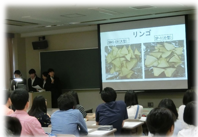
「乾燥果物の有用性」