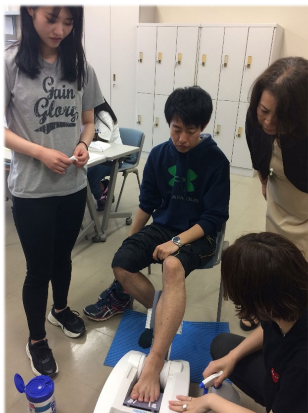
「アスリートへの栄養サポート」