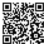
交通アクセス <本学ホームページ>