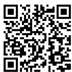
交通アクセス <本学ホームページ>